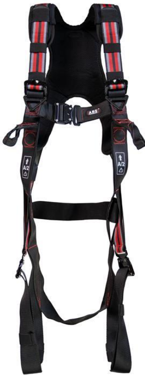
Fig. 1: Harnais d'antichute, type : ABS Comfort