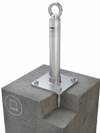
Bild 1: Anschlagereinrichtung, Typ: ABS-Lock® X-SR-AS (Direktmontage)

Der Einzelanschlagpunkt ist konstruktiv so ausgelegt, dass er die zu erwartenden Kräfte bei der Kombination mit den ABS-Lock® SYS I bis SYS IV Drahtseilsystemen bei der Belastung durch einen Sturz aufnehmen kann. Bei dieser Anwendung dient die Anschlagereinrichtung als End-, Zwischen- sowie Kurvenanker von Drahtseilsystemen nach DIN EN 795:2012 Typ C der ABS Safety GmbH. Anstelle der Ringschraube können entsprechende Seilführungskomponenten montiert werden. Die Anschlagereinrichtung besteht aus korrosionsbeständigem Stahl und kann in alle Richtungen, parallel zur Bauwerksoberfläche, belastet werden.