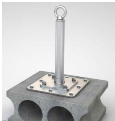
Bild 2: Anschlagereinrichtung, Typ: ABS-Lock® X-SR-AS (Montage mittels Adapterplatte)